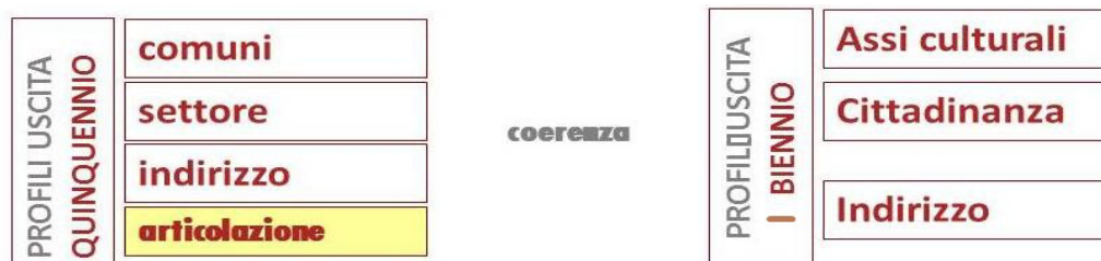
Fig. 1 – Profilo d’uscita

Lo schema per la costruzione di questo “nuovo curriculum” viene di seguito rappresentato attraverso le due figure sottostanti.